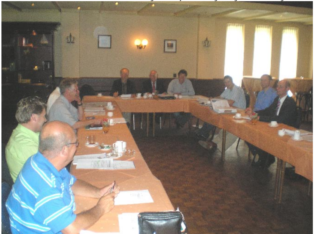
Foto genomen tijdens een vergadering van de uitvoeringscommissie