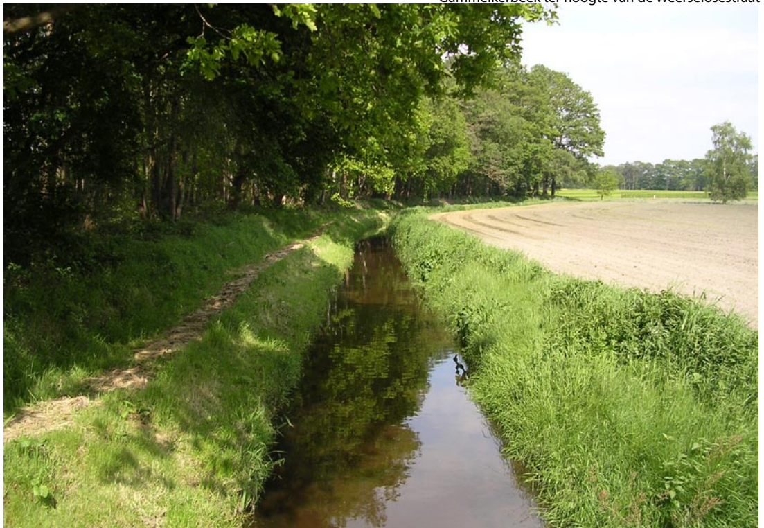
Gammelkerbeek ter hoogte van de Weerselosestraat