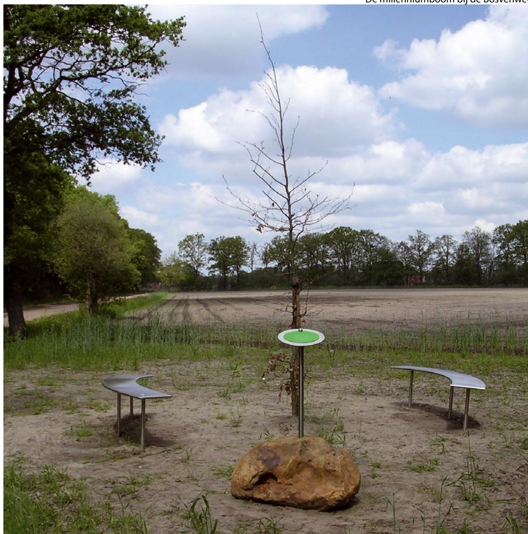
De millenniumboom bij de Bosvenweg

Om de doelstelling te bereiken worden per landschapstype landschapselementen gehandhaafd of aangelegd. De uitvoeringscommissie plant zoveel mogelijk bomen en struiken van inheemse oorsprong. Landschapselementen zijn onder andere bosjes, houtwallen, singels en wegbeplanting en geven de verschillende landschapstypes hun karakteristieke aanblik terug. Particulieren en Staatsbosbeheer realiseren een groot aantal landschapselementen.