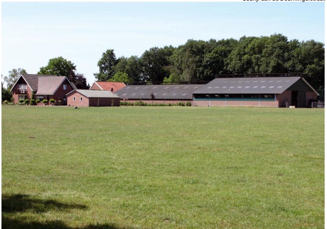
Bedrijf aan de Deurningerstraat

Waar verdergaande groei van de landbouw niet mogelijk is, kan verbreding van de inkomstenbasis of omschakeling naar andere vormen van inkomsten aan de orde zijn (bijvoorbeeld recreatie en toerisme, zorg, industrie, ambacht). Gezamenlijke ontwikkeling versterkt de mogelijkheden. Ook samenwerking tussen de agrarische sector en het midden- en kleinbedrijf (MKB) kan leiden tot nieuwe impulsen van innovatie voor beide sectoren. In de begroting zijn geen middelen opgenomen. Ondernemers kunnen hiervoor terecht bij de bekende organisaties zoals bijv. Stimuland.